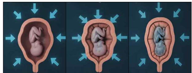
그림 2. Veo 비디오 생성 모델을 활용하여 개발한 자궁 과강직에 따른 태아의 병리적 진행 동적 시뮬레이션