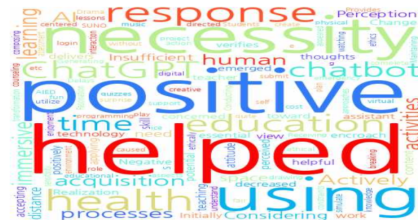
그림 5. 예비교사 주관적 경험 시각화 Fig. 5. Subjective experiences: Word cloud

예비교사의 주관적 경험의 빈번하게 출현한 단어들을 워드 클라우드(Word Cloud)로 직관적 시각화하였다. 이는 그림 5와 같다.