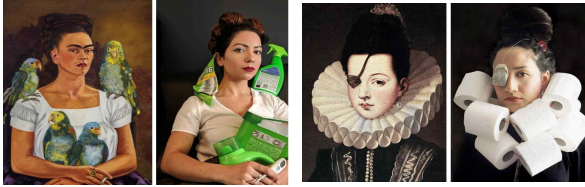
그림 1. 게티 박물관 챌린지 사례[45] Fig. 1. Creative case: The Getty Museum Challenge[45]

감상과 향유를 순환적으로 경험한다. 이는 게티 뮤지엄 챌린지가 단순 이벤트성 캠페인을 넘어 온라인과 오프라인을 경험을 넘나들며 창작과 소비를 동시에 경험하게 하는 초공간적 경험의 대표적 사례임을 보여준다.