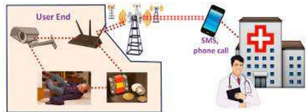
그림 1. 헬스케어 위한 스마트홈 센서