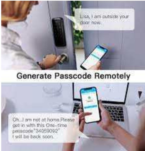
그림 2. 스마트도어락 Fig. 2. Smart Door Lock Keyless Entrance[18]

출입구에 관한 지침은 개폐 보조장치, 자동 커튼/블라인드 개방장치 등의 문과 창문을 중심으로 한 원격제어 서비스, 액추에이터 장착 확장에 의한 서비스의 확장성을 제시한다. 또한 도어 카메라, 디지털 도어 잠금, 도어 보안 디텍터 등을 통한 안전 서비스에 관련된 내용을 담고 있다.