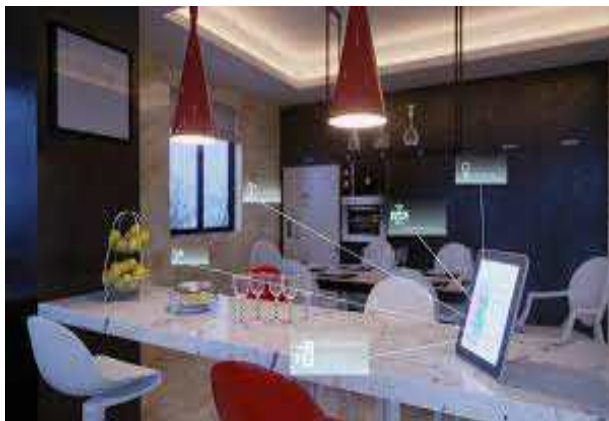
그림 4. 2021 최고의 스마트기기 Fig. 4. The Best Smart Home Devices for 2021 [20]