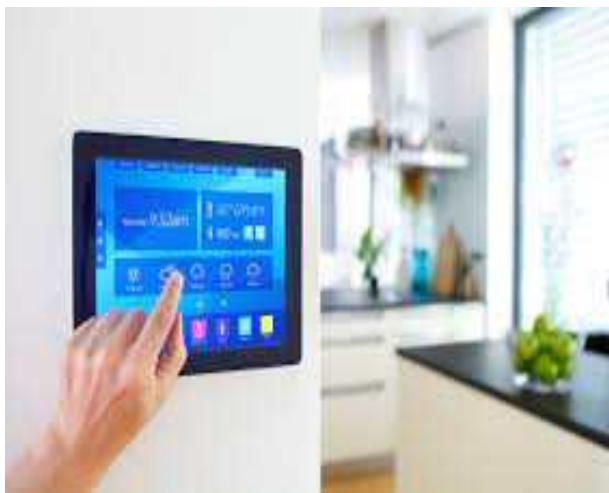
그림 3. 홈오토메이션 기기 Fig. 3. Room-by-Room Guide to Home Automation[19]